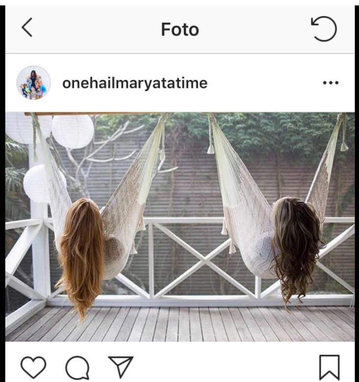
Abb. 2: Das analysierte Einzelbild im Kontext von Instagram Screenshot, iPad

Zur Einführung in die Umgebung „Instagram“ wird der folgende Bildausschnitt so gewählt, dass das Bild nicht ausgeschnitten sichtbar wird, sondern in seiner Kontext-Umgebung: Wie hier gezeigt, begegnet das Bild in der mobilen App am Smartphone und Tablet sowohl im Einzelbild-Feed als auch in der Einzelbild-Anzeige. Der schwarze Rand links und rechts deutet die Seitenbegrenzung der App an. Am oberen Rand wird die Steuerungsleiste von Instagram sichtbar, in der links „zurück“ und rechts „erneut laden“ gewählt werden kann. In der zweiten Bildzeile begegnen links das runde Accountbild sowie der Accountname, die drei Punkte rechts führen zu einem Kontextmenü. Unterhalb des Bildes sind vier Piktogramme (angeschnitten) zu sehen: Das Herz steht für „like“, die Sprechblase für „comment“, der Papierflieger für „teilen“. Rechts ist das Speichern des Bildes in der eigenen „Collection“ möglich. Alle beschriebenen Punkte können angetippt werden.