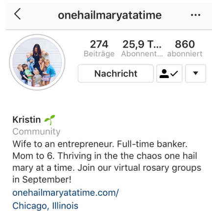
Abb. 1: Profil des untersuchten Accounts