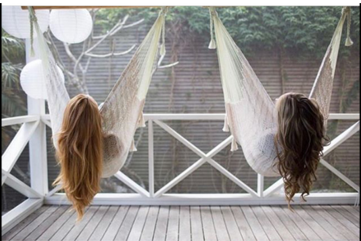
Abb. 3: Das analysierte Einzelbild Screenshot, iPad

Die formulierende Interpretation unternimmt zunächst die vorikonografische Beschreibung dessen, was zu sehen ist. Das Bild wurde im Querformat auf Instagram eingestellt. Es zeigt eine Außenaufnahme auf einer Holzveranda, auf der zwei Schaukelsitze hängen. In diesen sitzen zwei Personen, die in Rückenansicht aufgenommen sind. Von ihren Körpern sind nur die Köpfe zu sehen. Sie blicken über die Holzveranda hinaus auf eine Holzwand. Das Bild ist in einer hellen, gedeckten Farbpalette gehalten und im Vergleich mit anderen Bildern des Accounts auffällig zurückhaltend koloriert. Dominierende Brauntöne mischen sich mit weißen Strukturen und grünen Akzenten. Die linke Bildhälfte ist geringfügig heller ausgeleuchtet als die rechte Hälfte.