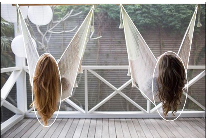
Abb. 4: Szenische Choreografie

Die Planimetrie (Ganzheitsstruktur) ergibt eine Einteilung des Bildes in rechtwinklige und runde Abschnitte. Einen rechten Winkel bildet die Brüstung der Veranda, die das Bild ziemlich exakt in der Hälfte horizontal zerteilt, mit dem tragenden Balken, der Holzwand und dem Wurzelwerk. Abgerundete Formen prägen den Hintergrund durch die hängenden Lampen und das rechts oben befindliche Blattwerk. Die perspektivische Projektion zeichnet den Blick bzw. die Perspektive des Kameraauges nach, folgt also der abbildenden Bildproduzentin und der damit einhergehenden Weltanschauung. Der Fluchtpunkt lässt sich aufgrund der Balken leicht konstruieren. Er befindet sich oberhalb der horizontalen, aber beinahe genau in der vertikalen Bildmitte, auf der Höhe des oberen Kopfrandes der beiden Frauen und ziemlich exakt in der Mitte zwischen den beiden Schaukelsesseln, auf der gegenüberliegenden Wand. Die Kamera befindet sich auf Kopfhöhe mit den abgebildeten Bildproduzentinnen.